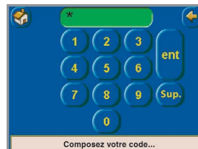
Saisie du code