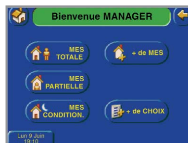
Écran de MES/MHS