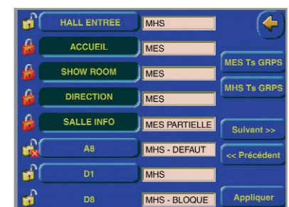
Etat des groupes de MES