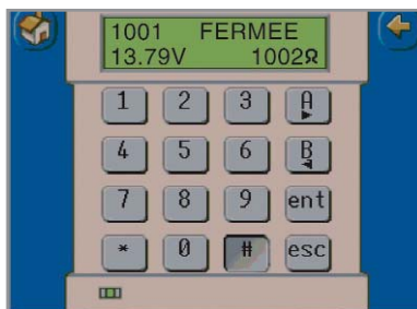
Emulation du clavier MK7