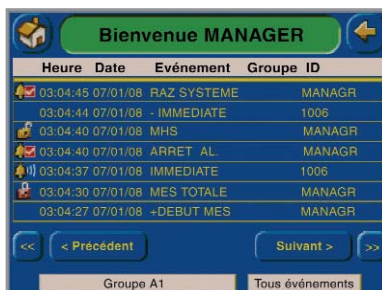
Journal des événements