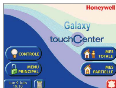
Écran d'accueil standard